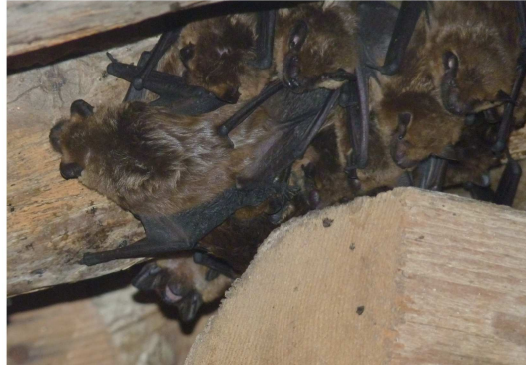
Colonie de Sérotine commune sous des combles