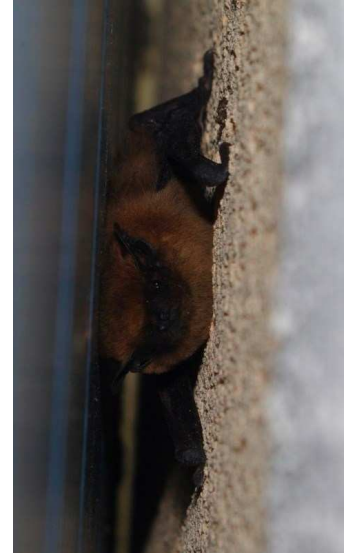
Pipistrelle sp. ayant trouvé refuge derrière le volet d'un bâtiment