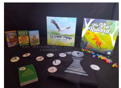
Don Bétula Jeux Nature