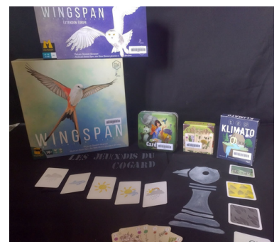
Prêt CPIE du Gard