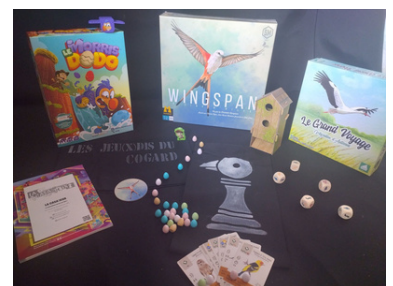
Don La Casa Jeux