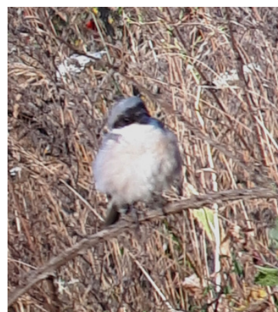
Cet oiseau est celui du causse de Blandas