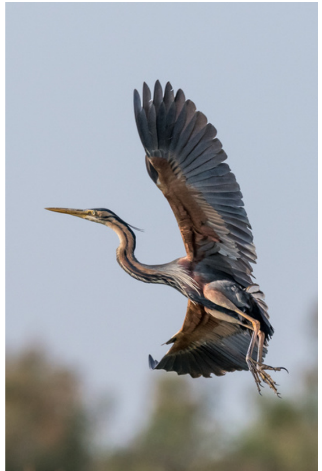
Héron pourpré - Christophe Grousset

Rendez-vous donc dans les pages du Midi Libre les samedis et dimanches des mois de juillet et août pour 18 chroniques.